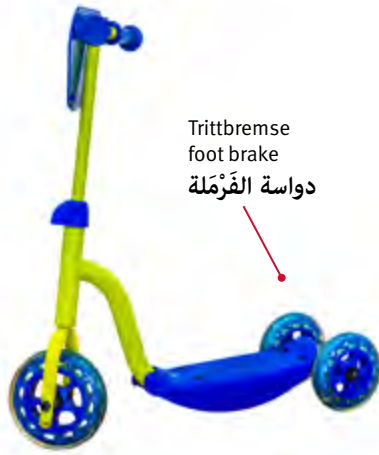
Trittbremse foot brake دواسة الفرملة