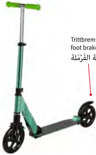
Trittbremse foot brake دواسة الفرملة