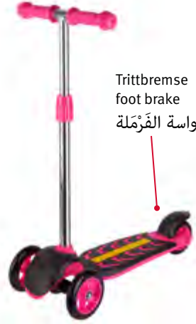
Trittbremse foot brake دواسة الفرملة