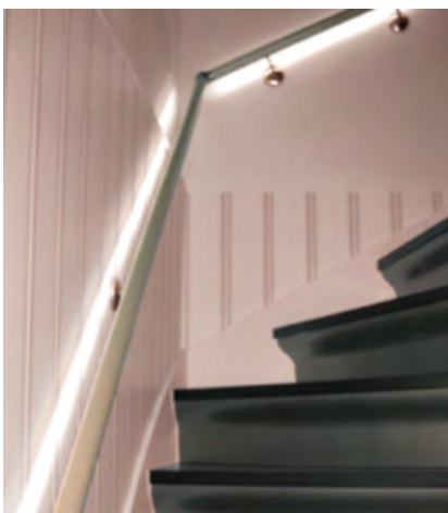
Geländer mit integriertem LED-Licht

VON MAIKE JASPERS, WISSENSCHAFTSJOURNALISTIN, MÜNCHEN.