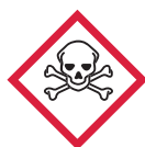
Giftig/ Sehr giftig