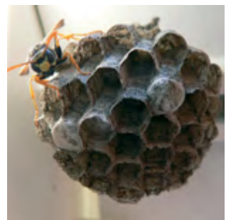
Wespennest im Kasten einer Markise