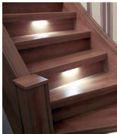
Treppenstufen mit LED-Beleuchtung