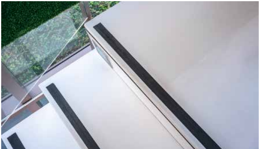
Treppe mit Antirutschstreifen