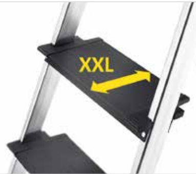
Anti-Rutsch-Riffelung und extra breite Stufen für mehr Standsicherheit.