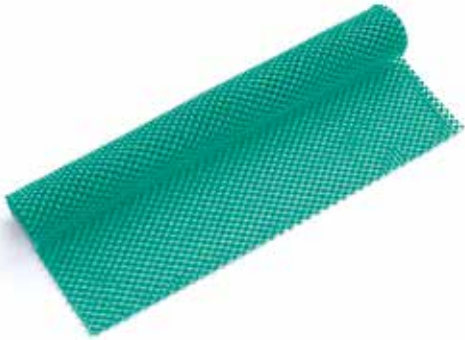
Beispiel für eine Antirutschmatte.

Türschwellen sollten möglichst entfernt werden oder eine andere Farbe haben als der angrenzende Boden. Ist das nicht möglich, sollten Rampen oder Schwellenkeile passend angebracht werden. Es gibt viele Modelle; wichtig ist die genaue Anpassung an Schwelle und Boden, damit hier keine neue Stolperfalle entsteht. So schlägt man zwei Fliegen mit einer Klappe: Die Stolperfalle ist weg, und Sie können auch mit einem Servierwagen oder Rollator in den Raum hineinfahren.