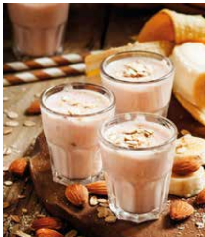
Smoothie mit Bananen, Joghurt, Haferbrei und Nüssen

Auch sportliche Bewegung (siehe Seiten 7/8) wirkt vorbeugend, da die Knochen widerstandsfähiger werden.