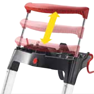
Ausziehbarer Haltebügel für mehr Standsicherheit