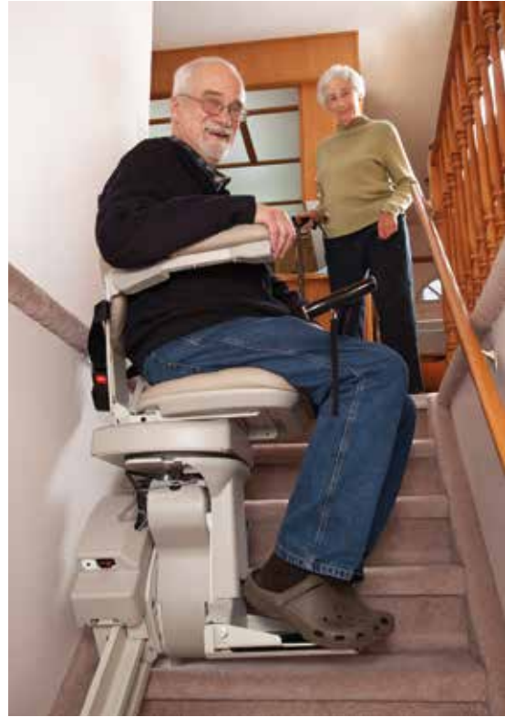
Nachträglich eingebauter Treppenlift

Die Umsetzung solcher und ähnlicher Überlegungen trägt zu einem risikoärmeren und weniger beschwerlichen Leben bei. Das Anpassen des eigenen Wohnraums an veränderte Lebensverhältnisse hilft somit, länger selbstständig und unabhängig zu bleiben.