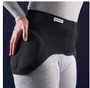
Sicherheits-Gürtel mit Klettverschluss