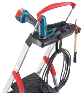
Ablage für verschiedene Befestigungsmöglichkeiten