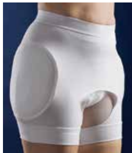
Offener Schritt und eingenahte Textil-Pads